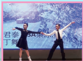
不容錯過的拉丁舞表演