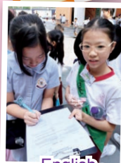
English ambassadors conduct interviews during recess!

You have many chances to practice your listening skills. When you watch an English movie or a TV show, switch off the subtitles and challenge yourself. How much can you understand? If you have some favorite songs in English, try to learn the words, and when you know them, sing along. If you own the movie or song, you can play it over again, helping you to "catch" what they're saying. You can play a short part of the song or show, and then practice mimicking what you hear. As part of your homework, you should be listening to the stories and texts used at school.