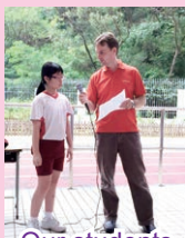
Our students like talking to our NET.

Of course, the best way to learn English is to immerse yourself in an English speaking environment. If your family takes a trip to a country where English is spoken, use this opportunity to practice. At school, the Speak-up Program gives you the chance to speak English with your schoolmates every Tuesday. Don't miss this opportunity!