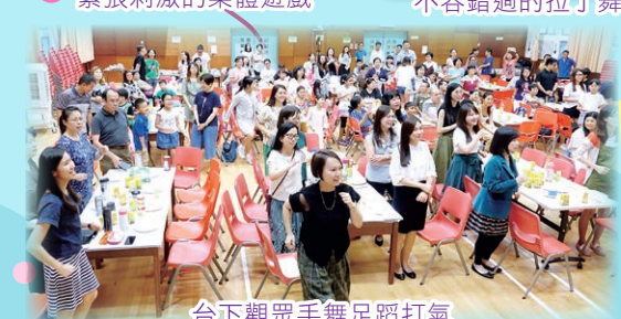
台下觀眾手舞足蹈打氣