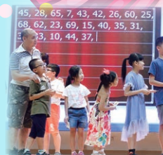
緊張刺激的集體遊戲