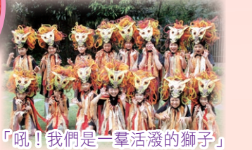
「吼! 我們是一羣活潑的獅子」