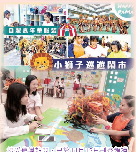
接受傳媒訪問，已於11月13日刊登報導

繼2012、2014及2015年後，本校榮幸再獲挑選，第4次參加「渣打藝趣嘉年華」的「巡遊服飾創作組別」。今年大會主題是大家熟悉的「綠野仙踪」，我們扮演故事中膽小的獅子。由駐校藝術家主持工作坊，帶領同學們親手製作巡遊服飾。我們的同學接受不同的挑戰，除了學習製作技巧外，還要充份發揮合作精神，才能於14個小時內完成所有服飾。10月20日，本校獲明報邀請接受訪問，分享學習心得，同學們的表現獲大家的認同，在訪問的過程中也反思箇中所學。巡遊活動終於在2018年11月4日順利完成，同學們發揮超水準表現，戴著沈重的帽子，仍能展示燦爛的笑容，一邊與圍觀的公眾人士擊掌揮手，一邊載歌載舞，贏得不少喝采聲呢! 願同學們汲取這個寶貴的體驗，延續對藝術的熱情。