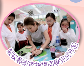
駐校藝術家指導同學完成作品