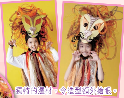
獨特的選材，令造型額外搶眼。