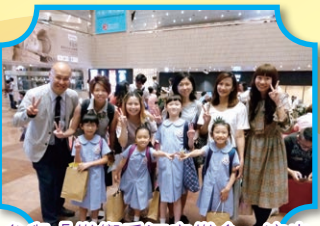
參與「樂響香江音樂會」演出