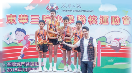
本校首次勇奪男子甲組全場總冠軍