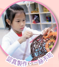
認真製作，一絲不苟