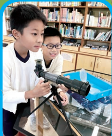
參觀可觀天文教育中心