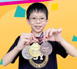
青衣區游泳分齡賽2018