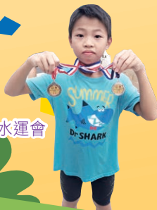
第七屆北區體育會水運會