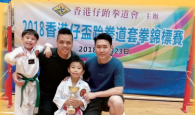
香港仔盃跆拳道套拳錦標賽