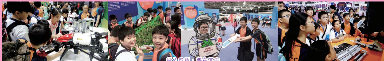
投入參與，樂在其中