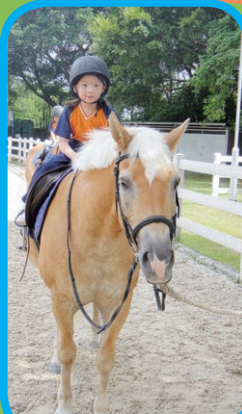
參觀屯門公眾騎術學校