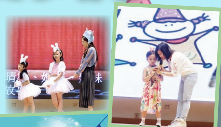
台上親子演出盡顯默契和溫情