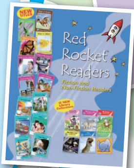
Students can enjoy reading different interesting books at home!

The great thing about reading is you decide the pace you go, and you can go back over any words you find difficult. We have a large selection of English books in our library available to read. I am sure you will find something at your level that interests you. When you see a word you don't understand, look it up in a dictionary, or ask someone, like your teacher, what it means. It is also a good idea to sometimes read aloud. You could read the book to a friend or someone in your family. Every week, you get your home reading folder, make sure you read the books included, this is an important part of improving your reading skills.