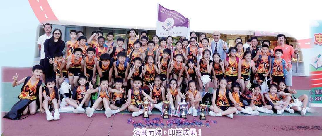
滿載而歸，印證成果！