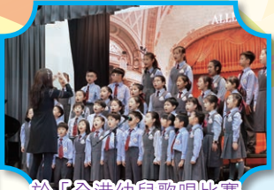
於「全港幼兒歌唱比賽 (初賽)」中演出